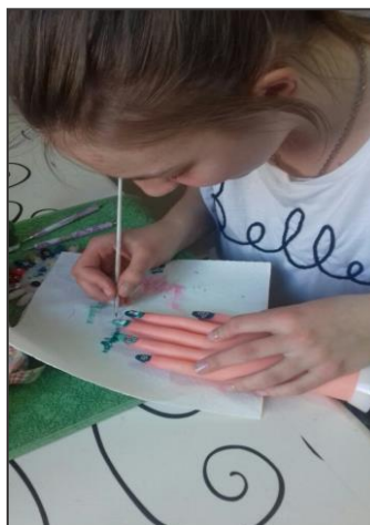
pedikűr és manikűr